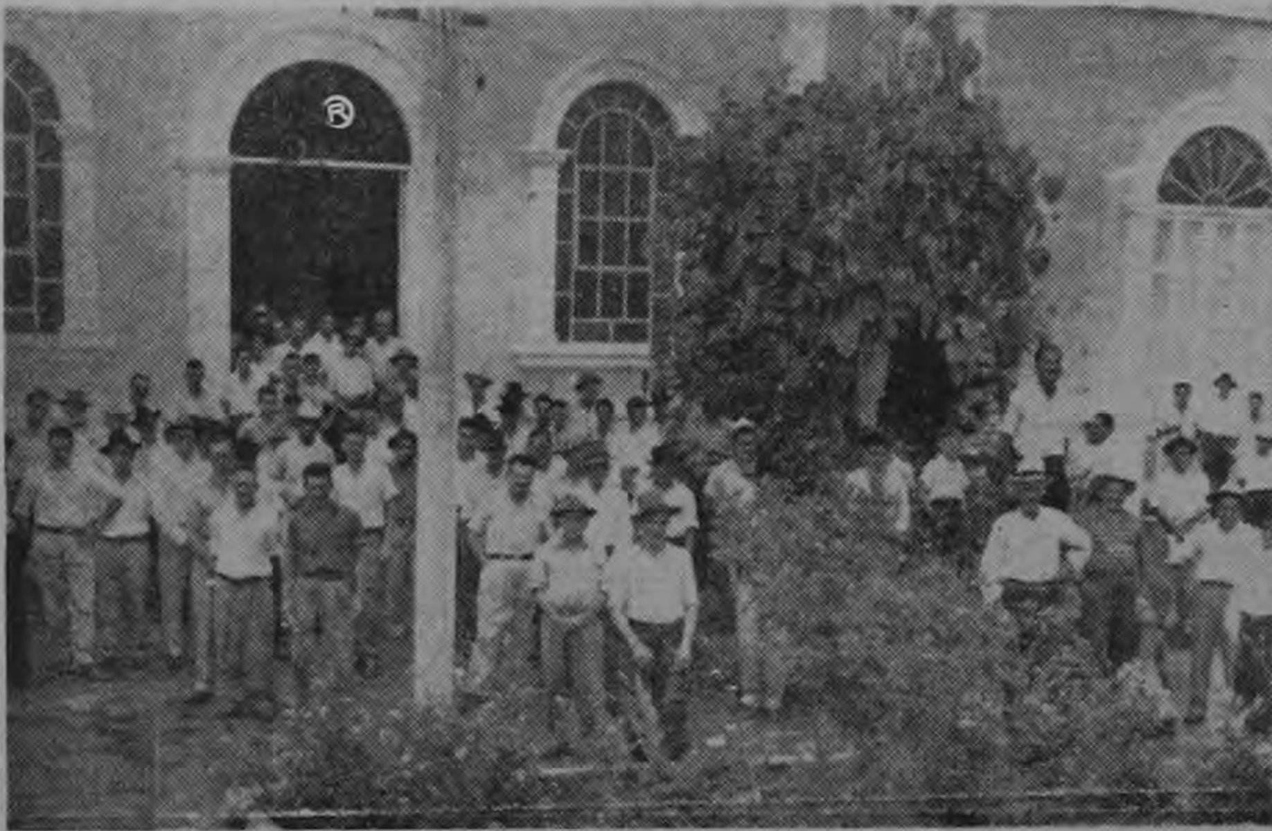
A un costado de la Iglesia de San Pedro de Poás, los cañeros posan para LA REPUBLICA. La reunión para la formación de una cooperativa que asociará a todos los productores de esta rica zona, fue un éxito.