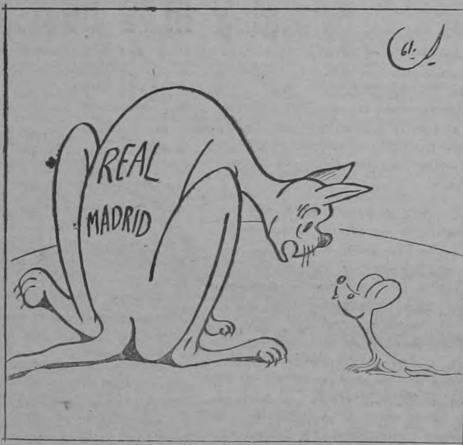
EL RATON.—Gracias por los dos goles que te dejaste meter... EL GATO.—Y yo por los treinta mil dólares que te dejaste sacar...